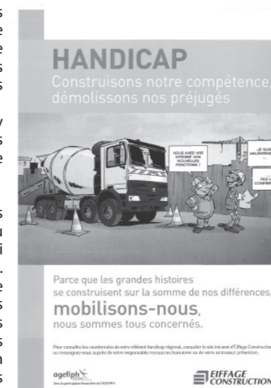
Handicap, changeons de regard

De ce fait, nous avons réduit notre taux de cotisation Agefiph, plutôt que de prendre le parti de la sous-traitance. Nous avons fait le choix d'entrer dans ces critères d'obligation d'employer des personnes handicapées, avec les compétences en interne.